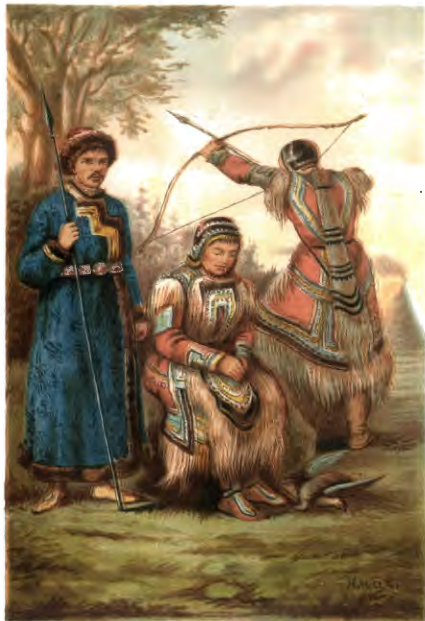
Т У Н Г У З Ы .