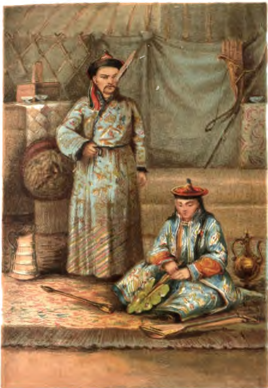
Б У Р Я Т А .