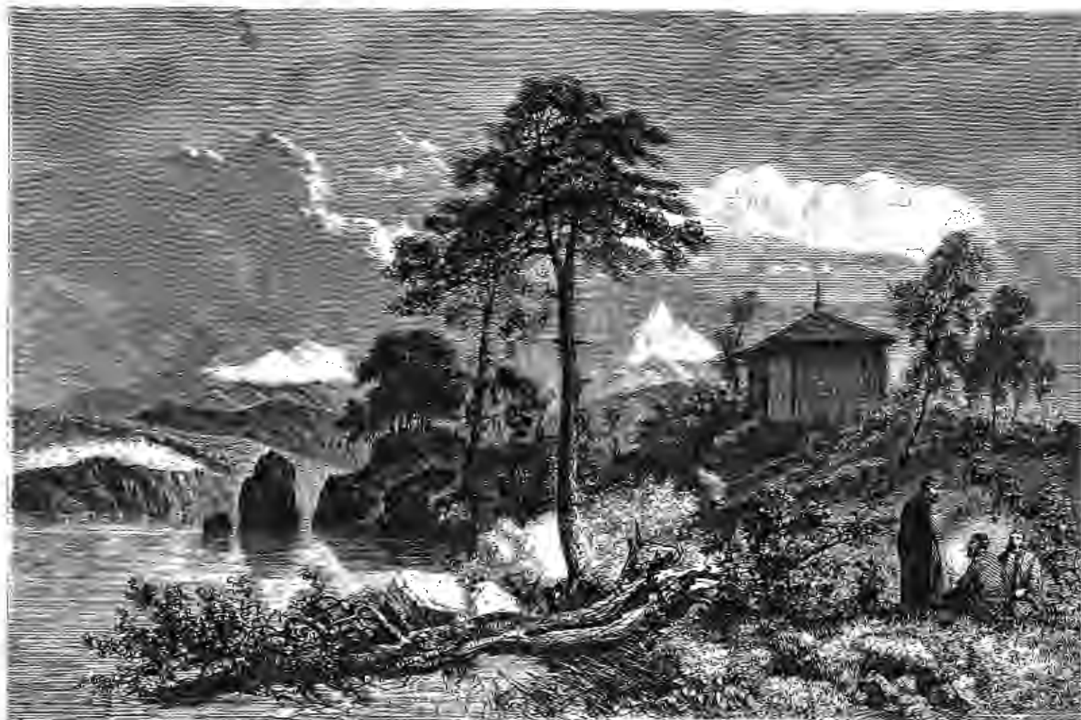
ТУНГУСКИЙ ХРАМЪ НА АМУРѢ.