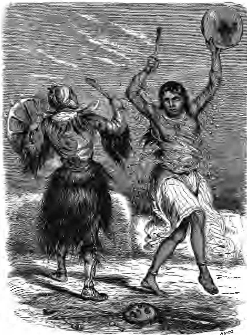
ШАМАНЪ И ШАМАНКА.

Олени два раза въ годъ переправляются черезъ рѣки, весною и осенью, но, по краткости лѣта, оба промысла отдѣлены одинъ отъ другаго только короткимъ промежуткомъ времени, хотя по изобилію въ добычѣ они весьма различны. Первый промыселъ оленей бываетъ въ концѣ мая, когда безчисленными табунами оставляютъ они лѣса и тнутся на сѣверныя тундры, отыскивая лучшій кормъ и избѣгая комаровъ, съ первою теплою погодою являющихся во множествѣ и мучительнымъ кусаньемъ отравляющихъ пріятность бѣднаго сибирскаго